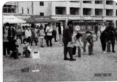
訓練による消火器の水

10月20日10時から『自主防災総合訓練』を陽明小学校で実施しました。準備予定日に雨に見舞われ、訓練当日早朝からの準備を余儀なくされましたが、関係各所ご協力のお陰で開会までにスムーズに準備が整えられました。 開会を前に、校庭には消防車が到着、続いて防災士会・役所の方々が到着され、9時20分には行政防災無線で本日は訓練であることと災害発生を告知しました。同時に自治会の青パト車は避難訓練対象地域に向け避難の必要性を伝播し巡回しました。避難は先ず近くの一時的避難場所に集合し安否確認の後、集団で避難所に移動していただきました。予定通り10時前には訓練参加の方が次々に校庭に集まってこられ、避難誘導部長より避難者数・家屋損壊・火災発生状況の報告を受けました。避難経路でのトラブルもなく、多くの参加者の下、避難訓練は順調に終了しました。今年は特に子どもさんの参加が多く、賑やかな避難訓