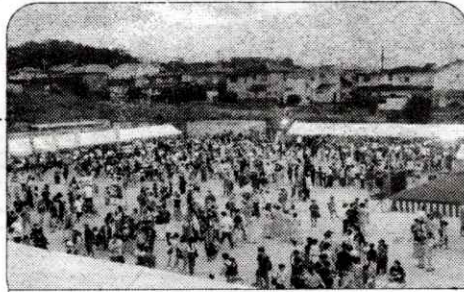
多くの人たちが夏の夜を楽しみました。