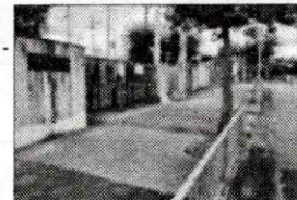
生き活きクラブが除草してきれいになった正門前

「生き活きクラブ」が開催に合わせて猛暑の中、会場周辺の除草作業をしてくださいました。