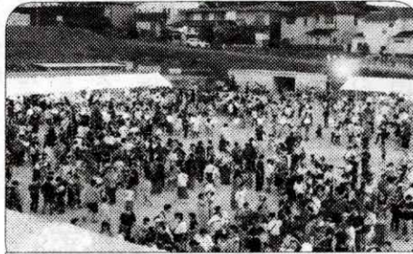
たくさんの皆さんがつどい楽しみました

今年、陽明小学校の50周年にあたり、PTAが企画して子どもたちがパフォーマンスをしました。恒例の盆踊りは会場がひとつになっ