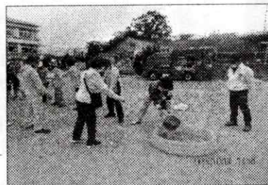
バケツリレーの様子

大地震が起きることで最も被害を拡大させる火災について初期の段階で消火できるよう消火器の使い方や性能について学びました。多くの人が水消火器の重要性を理解しました。初期消火の重要性を理解しました。バケツリレーでは、児童中心に2チーム(1チーム20名)を作り、どちらのチームが早くバケツリレーし、消火できるかを競いました。早く消火できたチームには記念品を貰えることから競争心に満ち溢れ、防災学習として大変盛り上がりました。