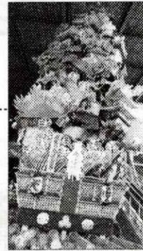
山笠の鬼退治の物語

福岡の有名なお祭りに出される「山笠」その展示されていた「山笠」の題材が我ら当地の「多田神社にお祀りされている、満仲公の鬼退治の物語」山笠の一番上部に満