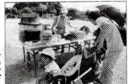
炊き出し用グッズ

ました。運ばれた用具は、自治会の軽トラック2台分、密を避けるように展示ブースを設け、消火・情報収集伝達・避難誘導・救出・救護・夜間照明・炊き出し関連夫々の用具に説明をつけて展示をしました。 展示は阪神淡路大震災を報じた当時の新聞から始まり、震災を経験された方は当時を思い出されて災害が身近であることを再認識されたことと思いません。防災用具は専門的な