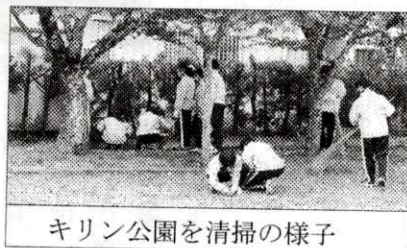
キリン公園を清掃の様子

10月22日に、緑台高校生が向陽台、緑台の公園の落ち葉やごみの清掃を行ってくれました。この活動はふるさと貢献事業の一環として近隣地域の美化に励み、奉仕活動を通じ地域への愛着心及び住民の方々と連携